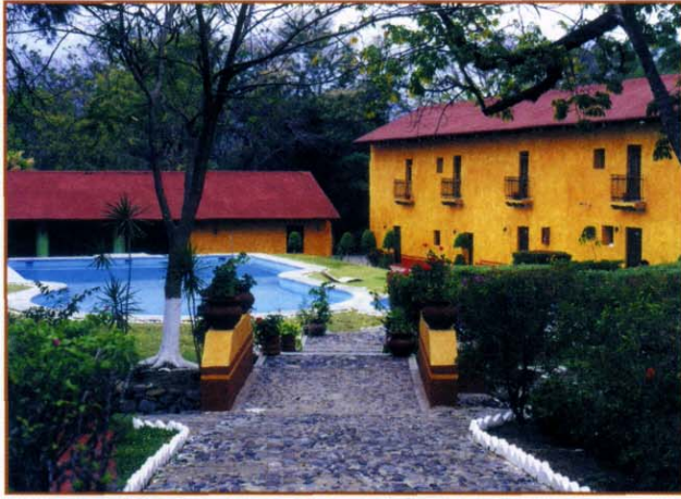
Hotel Ex-hacienda de San Nicolás, Conocó